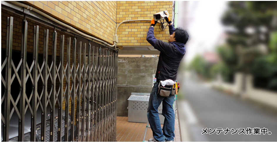
メンテナンス作業中。

弊社スタッフが毎日風雨にさらされているカメラを清掃いたします。 メンテナンスは、汚れを原因とする故障を未然に防ぐ事が出来ます。